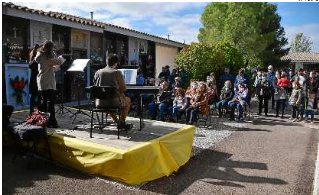
Música en homenatge als difunts per Tots Sants a Linyola.

tiu de grau mitjà de tècnic en pedra natural, amb l'objectiu de buscar la seva col·laboració per restaurar diferents elements del cementiri que es troben destruïts o deteriorats. Des del centre, on tenen un taller propi, ho van veure com una bona oportunitat per incentivar l'alumnat amb treballs reals durant les classes pràctiques.